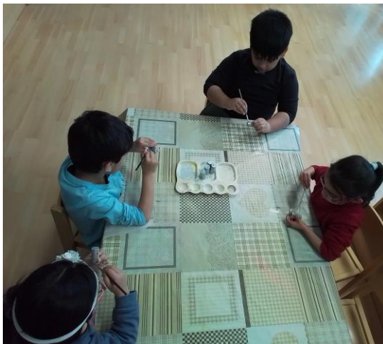
Riuso di tappi di sughero per realizzare decorazioni per l'albero di Natale.