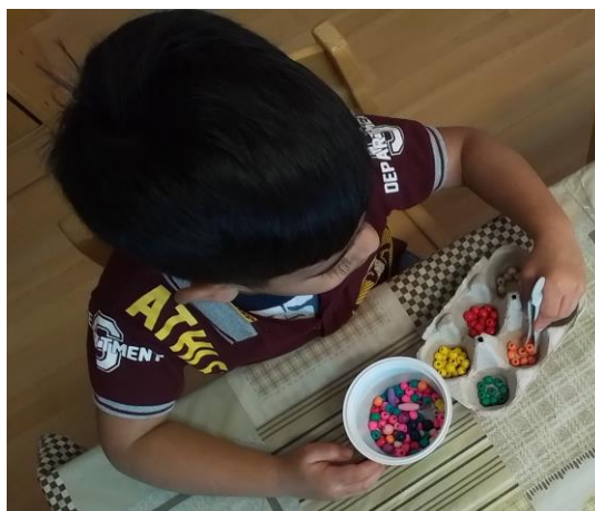
Riuso delle confezioni delle uova.